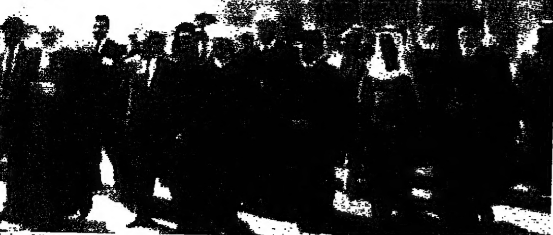
رئيس اللجنة مودعا الرؤساء الروحيين حتى الطائرة

صفير: نتمنى ان تضع اللجنة تصورا للحل خاله: لمساتو جمعاً عرياً صادقاً حكيم: نأمل نتائج واقعية شمس الدين: اللجنة حققت نجاحاً اضافياً